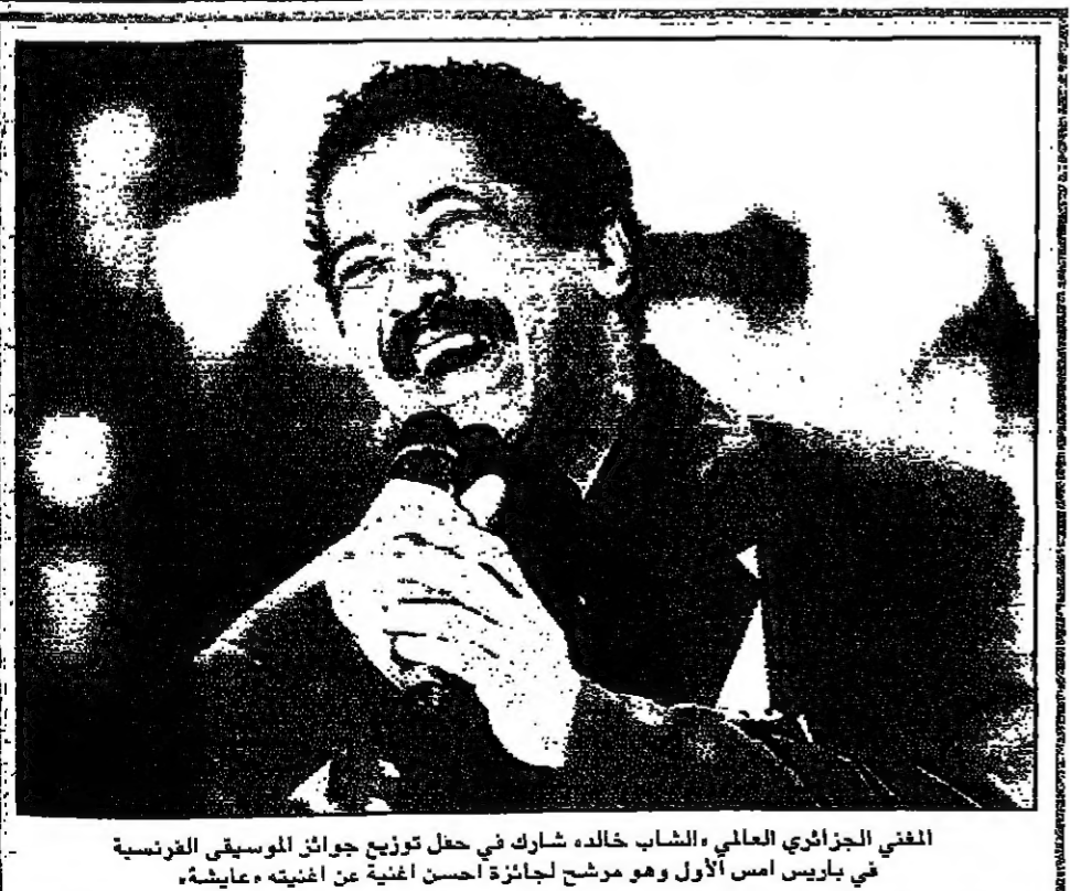
المغني الجزائري العالمي الشاب خالد شارك في حفل توزيع جوائز الموسيقى الفرنسية في باريس أمس الأول وهو مرشح لجائزة أحسن أغنية عن أغنيته «عاشق»

لم أكن اعرف ما هو طبيب النور، وان سمعت المثل يتردد مثل طبيب النور.. ولقد حسبت ان النور يختصون بطبيب حكر عليهم تحديد، الى ان جاء ذلك النساء الرضائي وفرع باب البيت الذي كنت اسكنه مع اسرتي في مخيم اليرموك قرب دمشق. فحقت الباب واذا بصيغتين توريختن تقفان متحادثتين واحداهما تحمل بين يديها خذرة كبيرة.. قالت لي: نريد شيئا من الطبيب، ولائي كنت يومها وحدي - والاسرة كانت في زيارة للامل في الاردن - فلم يكن عندي طبيب.. ولكنني وأنا ارى في الطنجرة الكبيرة فاصوليا وبامية وملوخية ورازا، ساتت الصبية: واين مستخدمين الطبيب الذي سادهم لك؟ اشارت الى الطنجرة وقالت مع ابتسامة واقفة: هنا، مع هذا الطبيب، انا هذا هو طبيب النور، كله على كله.. جارتا في مخيم النورمية كان يخطب السلطة بالسردين بالببيض و... بلنهم الخليل المنقر المحبب، فلسفته في هذا الشأن، كل شيء سيختلط في البطن.. المعنة.. فلماذا تنقز من حلقه سلحا؟! صديقي العزيز الذي ورطته في شراء ستلايت، او دش، وبالعربية (صحن) منماني في اليوم قبل الاخير لتناول طعام الافطار على عدي، واما الماحه لبوت الدعوة، مع انني في رمضان تحديدا اتهرّب من الدعوات - على قلتها - واخلف الأعداء للبقاء في البيت وتناول طعام الافطار مع افراد اسرتي والتعدد بعد الافطار والتذّب بكل القطاقت ومتابعة السلسلات والفوازيين - وهي تافيه بالاجماع - بعدم اهتمام.